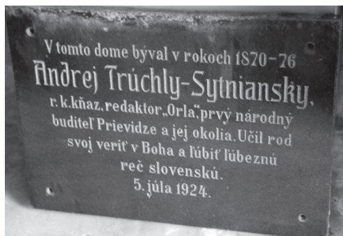
Pamätná tabuľa osadená v roku 1924 na budove starej prievidzskej fary.