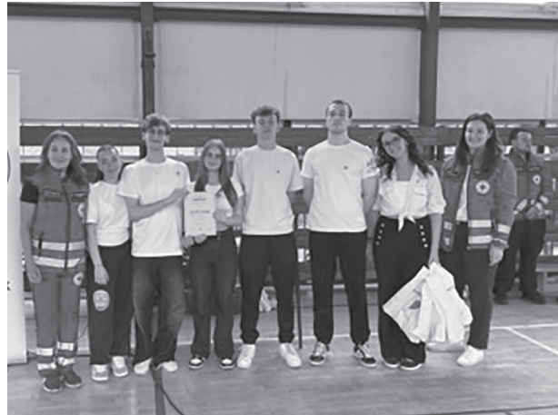
Okresná súťaž v poskytovaní 1. pomoci