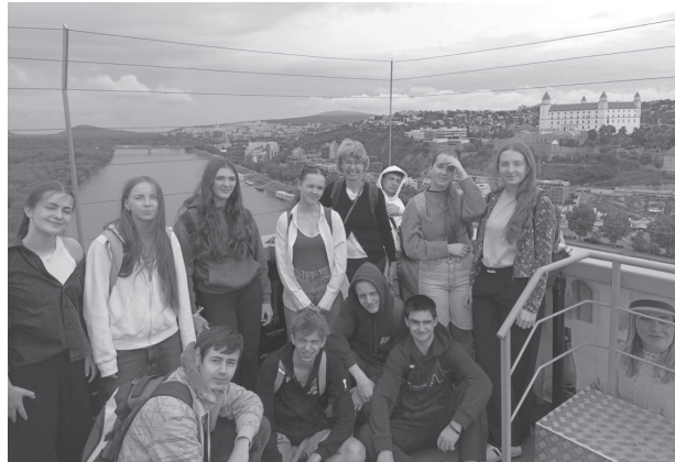
Kvartáni na výlete v hlavnom meste

Pripravili: Elena Blašková a Simona Lomnická