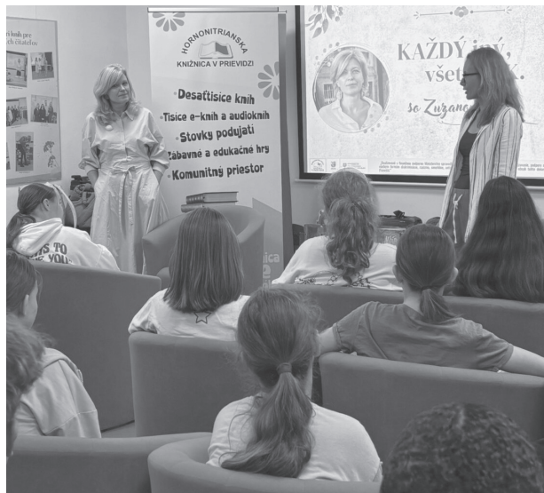
Beseda v knižnici: Každý iný, všetci O.K.