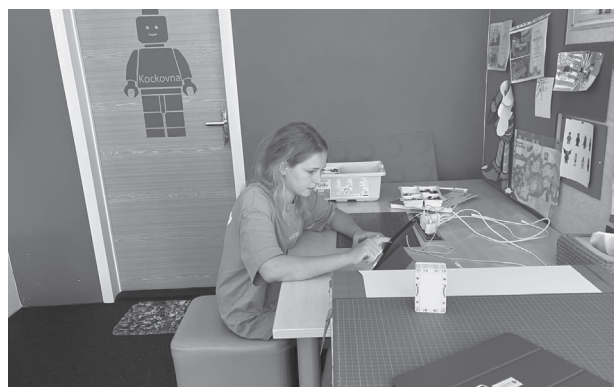
Skvelý deň v Kockovni v Martine