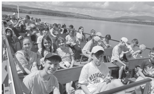
Piatáci navštívili Oravu