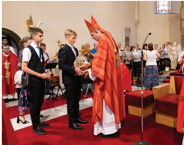
Sviatosť birmovania, farský kostol v Prievidzi - 21. júna 2026 (78 birmovancov)