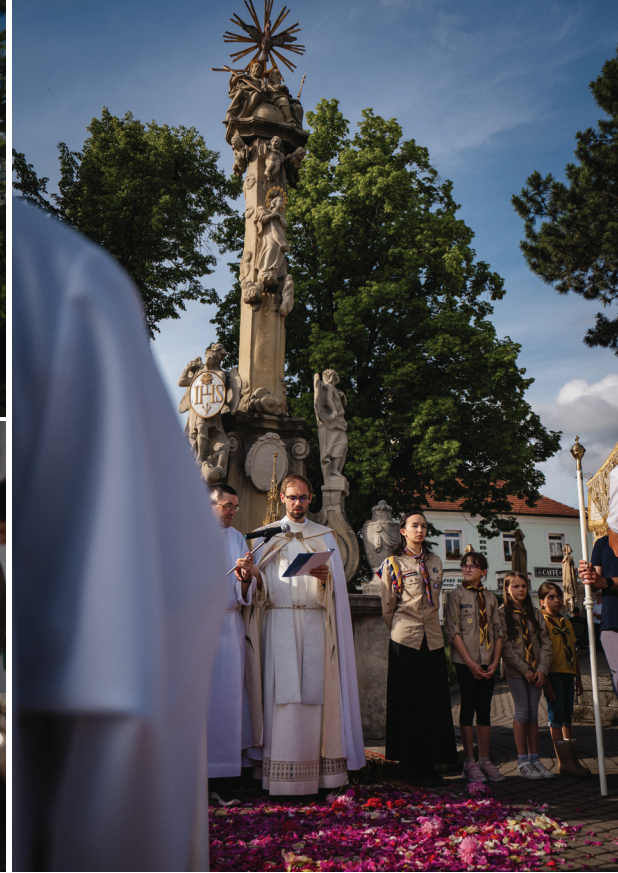
Sviatok Najsvätejšieho Kristovho Tela a Krvi, 4. júna 2026